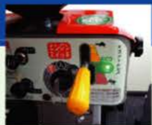
エンジン回転エコランプ

※エコドライブモードとは…搭載エンジンのもっとも燃料消費の少ないエンジン回転域を、エコランプを使って表示します。