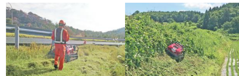
※プロポカバー標準装備