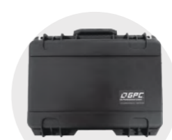
防水プロポ用ケース