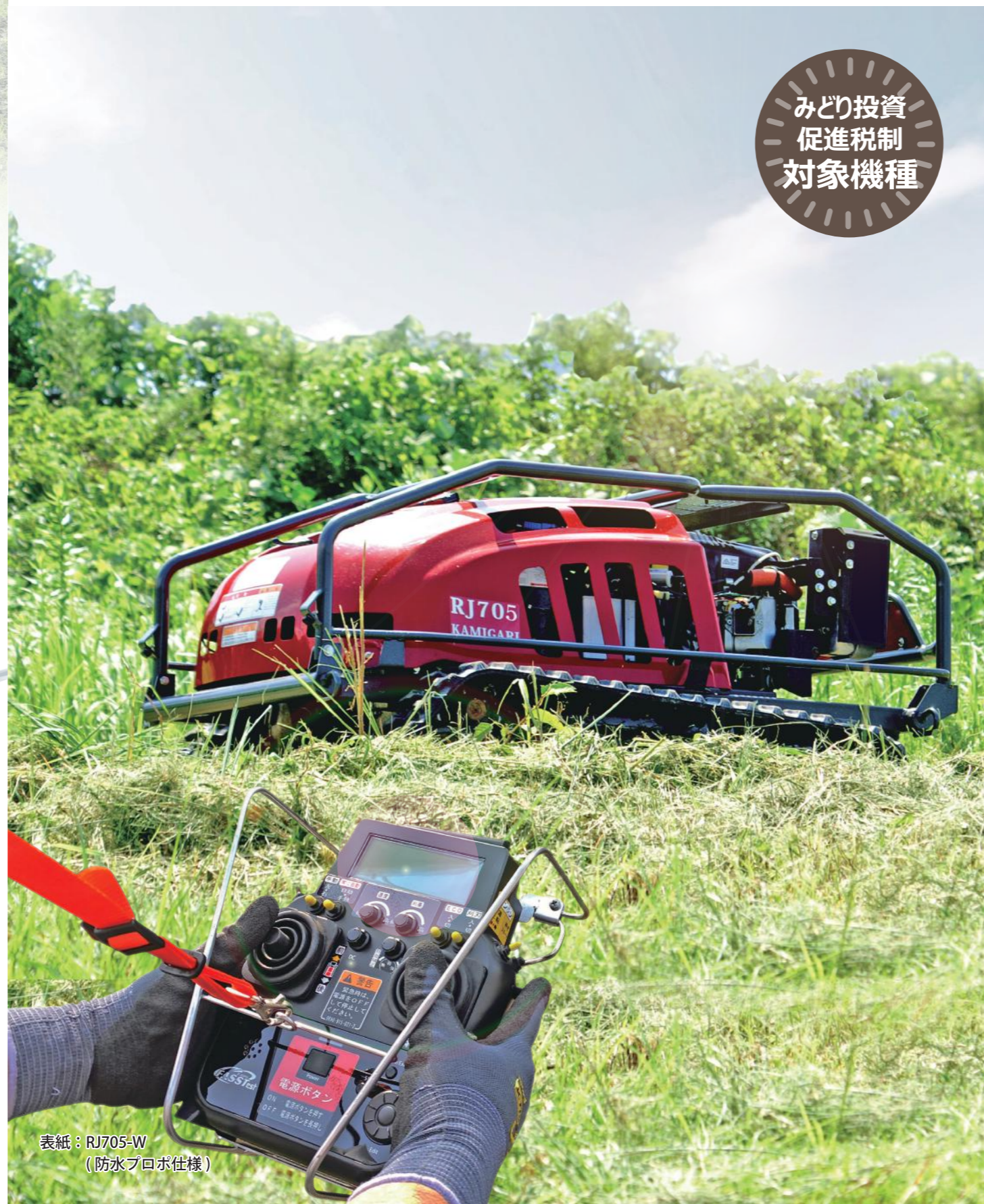
表紙: RJ705-W (防水プロボ仕様)