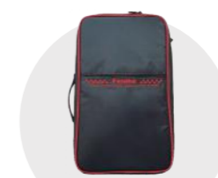
標準プロポ用ケース