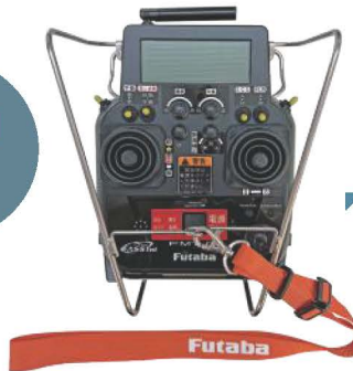
※写真は防水プロボです