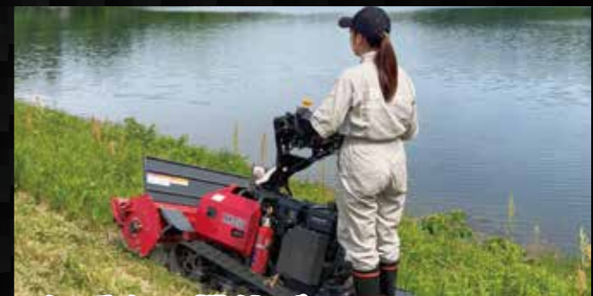
低重心の機体バランスで 30度の傾斜地でも安定した走行