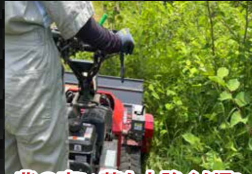
背の高い草も力強く刈取