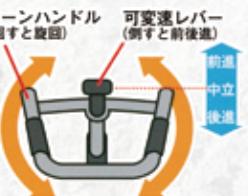
ターンハンドル (回すと旋回) 可変速レバー (倒すと前後進) 前進 中立 後進